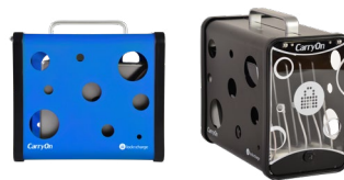
SKUs Blau: LNC10055 | Schwarz: LNC10049

Mehr als nur ein hübsches Gesicht. Bei diesem klaren und langlebigen Design trifft Form auf Funktion. Abgerundet wird es durch einen Aluminiumgriff für komfortables und einfaches Tragen. Erhältlich in den Farben Blau und Schwarz, passend für jede Umgebung.